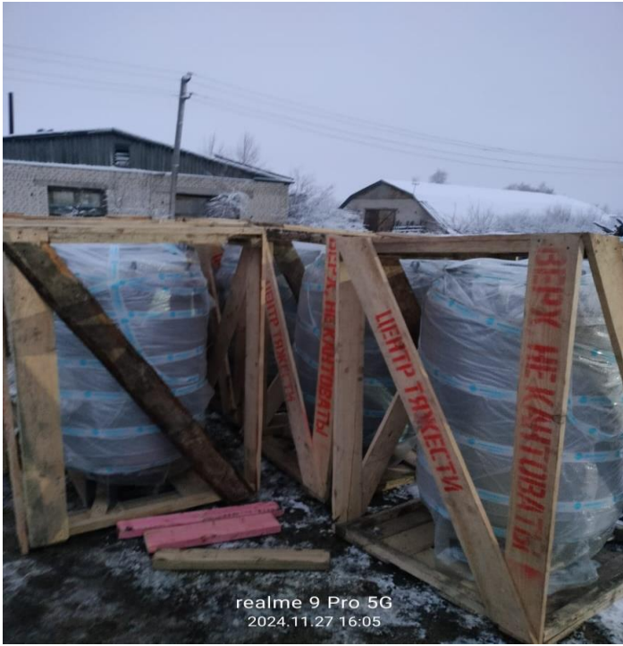
realme 9 Pro 5G 2024.11.27 16:05