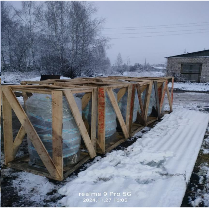
realme 9 Pro 5G 2024.11.27 16:05